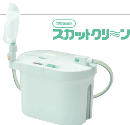
画像は男性用レシーバー装着済みのもの

スカットクリーンは、尿意の自覚があり、ご自分で、または介護する方の手助けによりレシーバーをあてがうことができる方にご利用いただけます。*尿意の自覚のない方、尿が常に出続ける方はご利用になれません。*大便には利用できません。